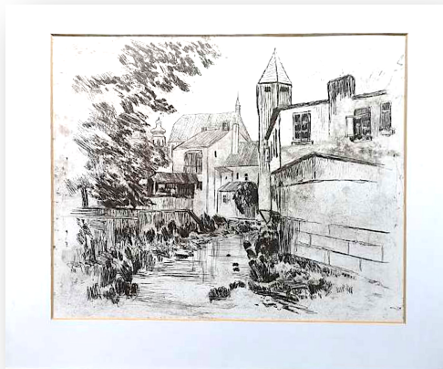
Radierung "Motiv am Mödlingbach" (Wehrgasse). Maße 64x44 cm