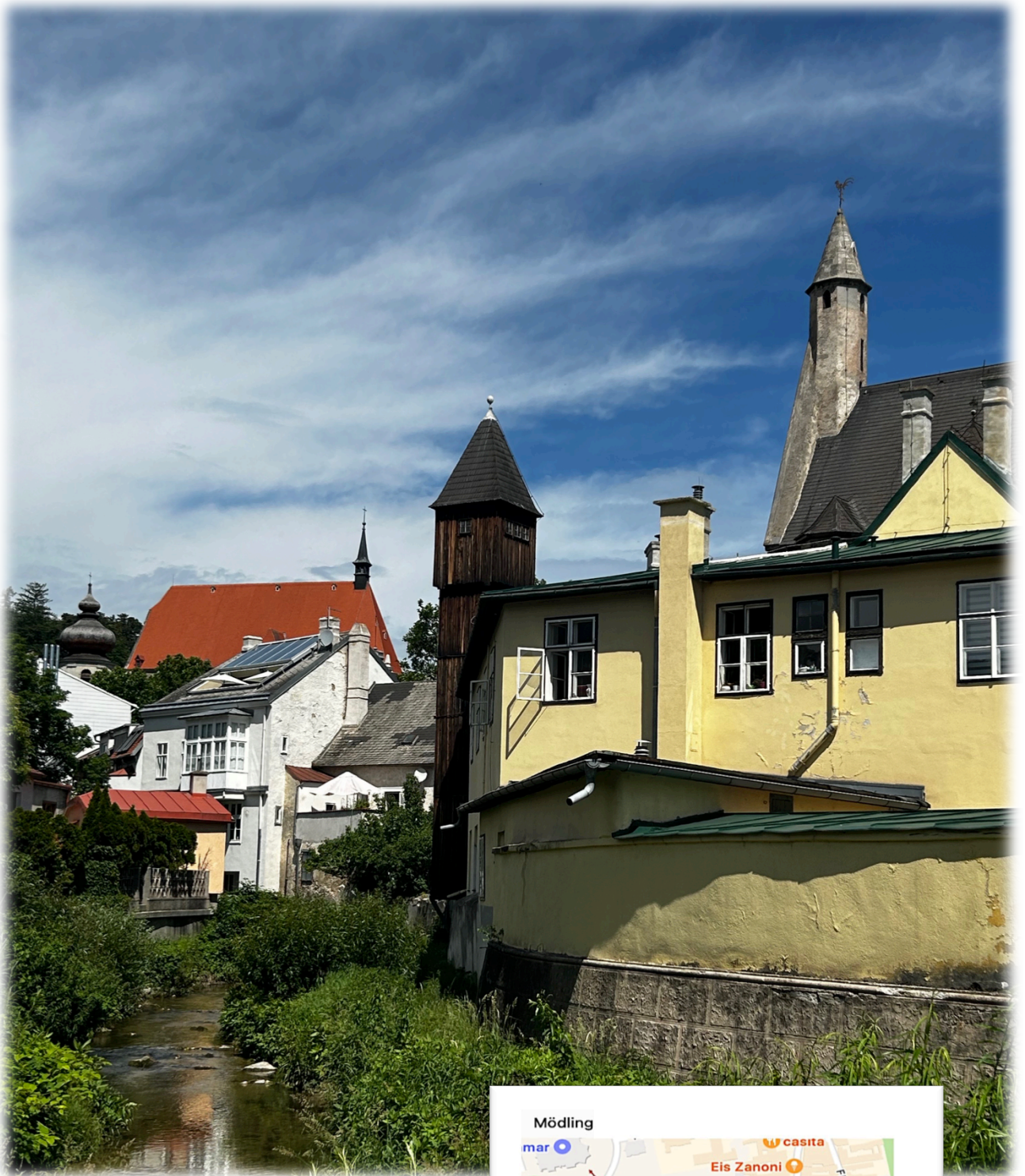
Der „3 Türme-Blick“